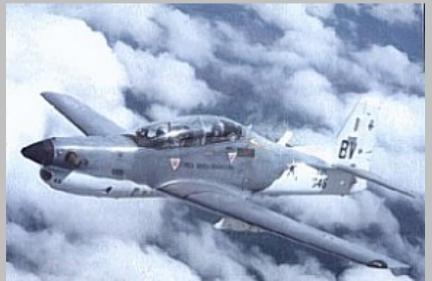
AT-27 Tucano matrícula FAB 1448 BV correspondiente al 1°/3° GAV.

El EMB.312 fue bautizado "Tucano" (Tucán) el 23 de octubre de 1981, un nombre sugerido por un cadete de la Academia de la Fuerza Aérea Brasileña, inspirado por esta ave típica de la selva amazónica; recibió la designación militar FAB T-27 para la versión de entrenamiento y AT-27 para aquéllos usados en misiones COIN de ataque al suelo con una respetable gama de armamentos distribuidos en cuatro afustes bajo las alas. 111 ejemplares de la versión T-27 mas 50 AT-27 fueron adquiridos por la FAB; además ocho ejemplares adicionales que se acondicionaron para equipar el Escuadrón de la Demostración Aérea de la Fuerza Aérea Brasileña "Esquadilha da Fumaca", entregándose estos el 29 de septiembre de 1983.