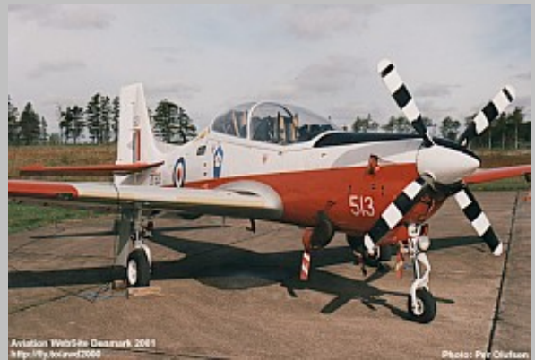
S. Tucano T.Mk.1 RAF ZF513