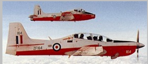
S. Tucano T.Mk.1 RAF ZF164, Foto autor desconocido fuente desconocida. Agradecemos cualquier información sobre el autor y la fuente de origen.