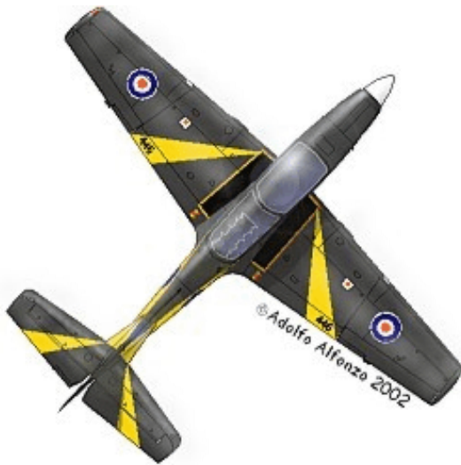
Dos vistas del Shorts TUCANO T.Mk.1 ZF446 Central Flying School, RAF Oxford, 2001.

EMB.312 Tucano en Egipto. De esta producción fueron exportados varias unidades a Irak.