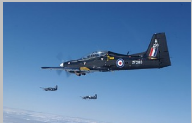
Dos excelentes tomas en formación del S. Tucano T.Mk.1 RAF ZF288, Foto autor desconocido vía RAF web site. Agradecemos cualquier información sobre el autor.