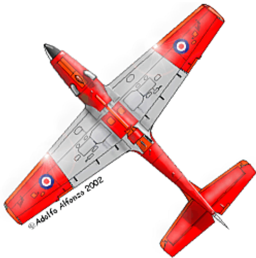
Tres vistas del Shorts TUCANO T.Mk.1 ZF344 Central Flying School, RAF Scampton, 1989.