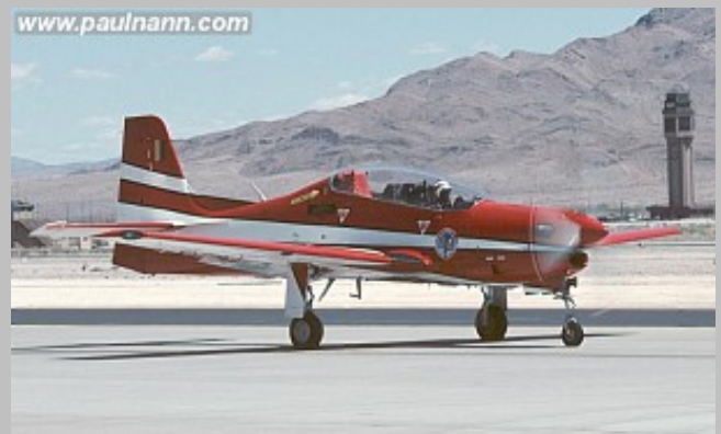
T-27 FAB 1382 "Esquadilha da Fumaca" 1988.