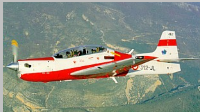
T-27 AdA 467 '312-JL', 3ème EIV Côte Bleue, Ecole de l'Air, Salon-de-Provence, 1997.