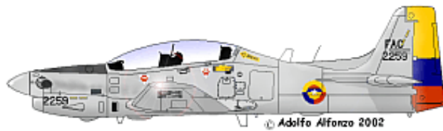
T-27 FAC 2259, Escuadrón de Combate No.312, Grupo 31, 1999.

El EMB.312 T-27 Tucano en la Fuerza Aérea Colombiana están asignados al Escuadrón de Combate No. 312 bajo el comando del Grupo 31 en la Base Aérea Luis F. Gómez Niño.