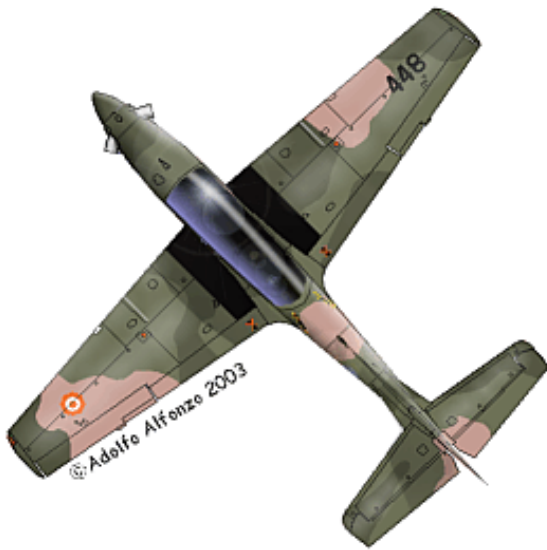
Dos vistas del AT-27 FAP 448, Escuadrón Aéreo Táctico No.514, GRU 51. 1999.