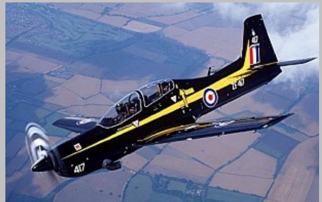
Excelente toma del S. Tucano T.Mk.1 RAF ZF417, Foto autor desconocido vía RAF web site. Agradecemos cualquier información sobre el autor.