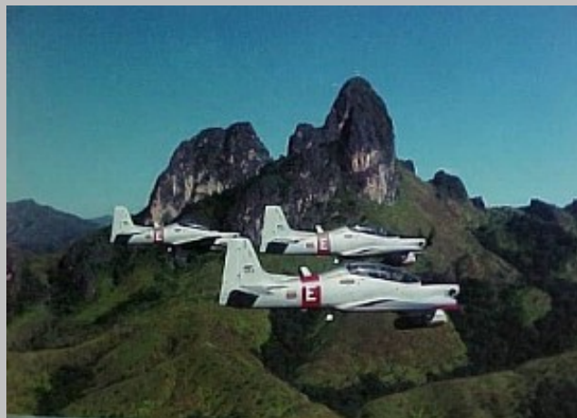
Formación de AT-27 Tucanos del GEA No.14 de la Fuerza Aérea Venezolana.