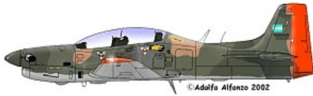
EMB.312 T-27 FAA E-231, Escuela de Aviación Militar, Cordoba, 1991.

Las primeras unidades EMB.312 T-27 Tucano de la Fuerza Aérea Argentina fueron recibidas en Junio de 1987 y son empleados para la instrucción en la Escuela de Aviación Militar bajo el comando del Grupo Aéreo Escuela en Cordoba.