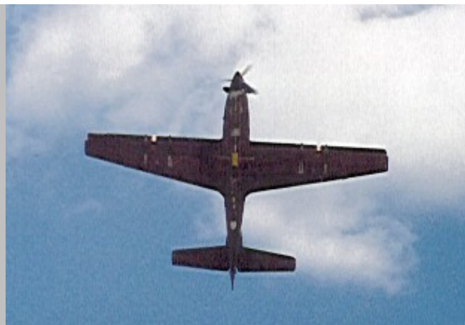
T-27 Tucano de la Fuerza Aérea Hondureña. Notese el color oscuro de las superficies inferiores.