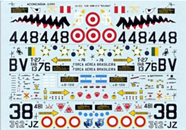
Calcomanías incluidas en el juego de ACONCAGUA.

Força Aérea Brasileira , sitio oficial de la FAB.