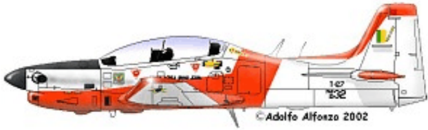
T-27 FAB 1332, 1° EIA, Academia da Força Aérea, 1981.