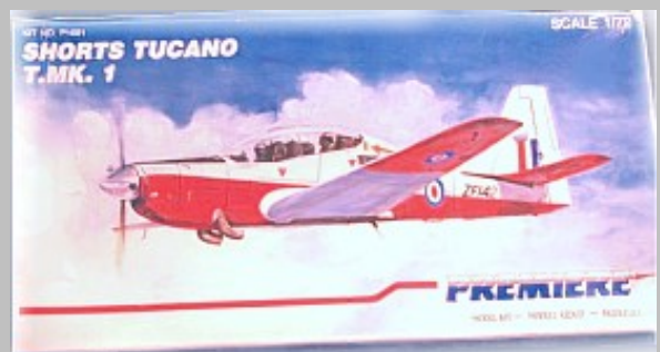
Decoración PREMIER No. P1001 edición 1989.

En la actualidad estos modelos no están en producción y son difíciles, pero no imposibles, de conseguir en el mercado. Todavía hay existencias en casas especializadas.