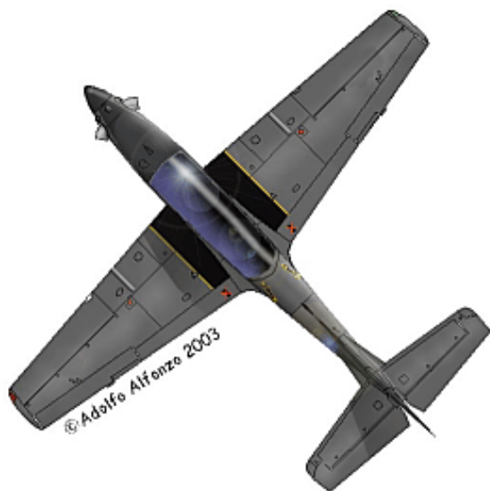
Dos vistas del AT-27 FAP 433, Escuadrón Aéreo Táctico No.514, GRU 51. 1995. Nótese la ausencia de insignias en las superficies superiores.