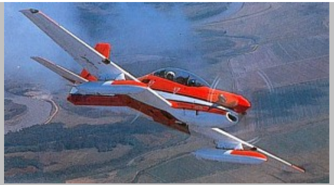
Excelente toma del 3er. prototipo del Tucano FAB 1302 con matrícula civil PP-ZDK. Foto autor desconocido, Fuente desconocida. Agradecemos cualquier información sobre el autor y la fuente de origen.

En el tercer prototipo, matrícula FAB1302, se incorporaron las modificaciones necesarias para los planes de producción, recibió la matrícula civil PP-ZDK y voló el 16 de agosto de 1982.