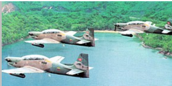
Formación de AT-27 Tucanos del GOE No.15 de la Fuerza Aérea Venezolana. Foto de vídeo, Fuente CD 80 Aniversario FAV, vía Delso López.

AT-27 FAH 257, B.A. Cnel. José Enrique Soto Cano, La Palmerola. 1999.