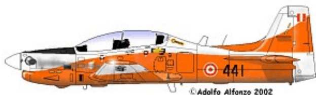
AT-27 FAP 441, Escuadrón de Instrucción básica No. 512, GRU 51. 1988.

intercepciones y una veintena de derribos de naves narco