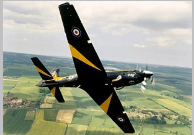
Dos fotos del S. Tucano T.Mk.1 RAF ZF446, Foto autor desconocido vía RAF web site. Agradecemos cualquier información sobre el autor.