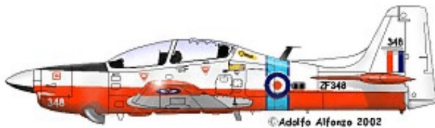
Shorts TUCANO T.Mk.1 ZF348 Central Flying School, RAF Cranwell, 1994.