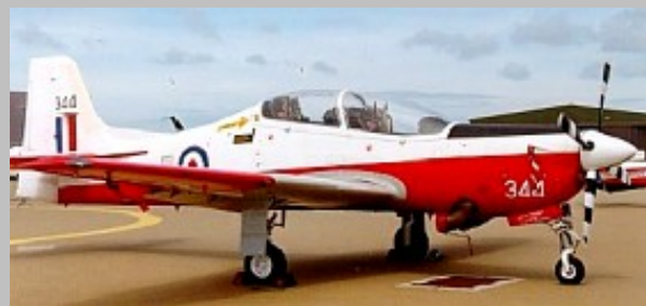
S. Tucano T.Mk.1 RAF ZF344, Foto autor desconocido fuente desconocida.

Externamente se evidencian modificaciones importantes en la que destacan el nuevo diseño del morro con una entrada de aire más amplia y dos grandes salidas de gases en la parte inferior. Exigencias estas, de la instalación de una turbina Garret TPE331-12B de 1.100 shp y un reductor que acciona una hélice de paso variable de cuatro palas incrementando la velocidad máxima a 514 Km/h a una cota de 4.567 mts. También se modificaron las extremidades de las alas incrementando la envergadura a 11,27 mts ; nueva disposición de los instrumentos de la cabina para conformarse a las exigencias de la RAF; nueva carlinga transparente reforzada "contra las aves" y con dispositivos explosivos de rotura para la eyección; Incorporación de un aerofreno ventral y menos evidente son los refuerzos que incrementan en un 50% mas la vida útil de la estructura.