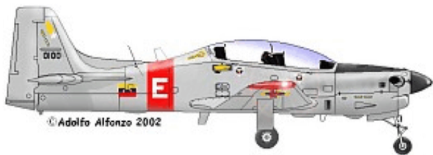
AT-27 FAV 0100, Grupo de Entrenamiento Aéreo No.14, 1991.

Dos vistas del AT-27 FAV 0203, Grupo de Entrenamiento Aéreo No.14 "Escorpiones", 1989.