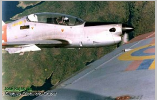
Formación de AT-27 Tucanos del GEA No.14 de la Fuerza Aérea Venezolana.

Más de 800 unidades se han vendido alrededor del mundo y actualmente equipa unidades de las Fuerzas Aéreas de Latinoamérica en Argentina, Colombia, Honduras, Paraguay, Perú y Venezuela. Por Europa en Francia y Gran Bretaña. Por el Medio Oriente en Egipto, Irán e Iraq y por Africa en Kenya y Gabón, estos últimos obtenidos de la Fuerza Aérea Peruana.