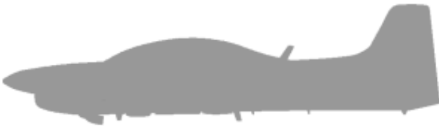
Dibujo en preparación

Obtenidos desde el Reino Unido, los Shorts Tucano T.Mk.51 de la Fuerza Aérea de Kenya están asignados desde 1990 a la unidad de entrenamiento y ataque en Nanyuki.