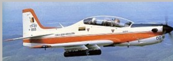
1er. prototipo YF-27 FAB 1300. Foto Austin J. Brown fuente desconocida. Agradecemos cualquier información sobre la fuente de origen.

El 6 de Diciembre de 1978, el Ministerio de Aeronáutica y la compañía EMBRAER firmaron un contrato inicial para el desarrollo del EMB.312, donde se incluían dos prototipos y dos ejemplares adicionales para pruebas estructurales. El primer prototipo, matrícula FAB 1300, voló el 16 de agosto de 1980 y el segundo prototipo, matrícula FAB 1301, voló el 10 de diciembre de ese mismo año fueron intensamente evaluados por el Departamento de Pesquisas e Desenvolvimento del Ministerio de Aeronáutica Brasileño en el Centro Técnico Aeroespacial de São José dos Campos.