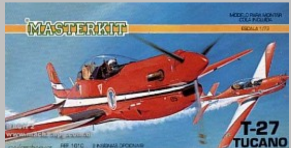
Decoración MASTER KIT No.1010 edición 1989.

Otra marca inglesa, AIRFIX, produjo en 1990, reeditó en 1996 y por último en el 2002, el juego No. 03059 serie 3 a escala 1/72 del Shorts Tucano T.Mk.1 en los primeros dos casos con la decoración típica de la Escuela Central de Vuelo "Central Flying School" de la RAF en Scampton con matrícula ZF138 (ver figura de la caja) y el último con el nuevo acabado en negro de "alta visibilidad" con matrícula ZF446 para operaciones de entrenamiento (ver figura de la caja). Contiene 48 piezas (1 transparente) de plástico inyectado en color blanco con detalles en bajo relieve. En general es un juego bien logrado recomendado para todo modelista.