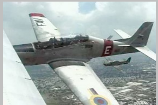
Formación de AT-27 Tucanos del GEA No.14 de la Fuerza Aérea Venezolana.