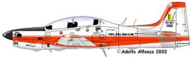
Prototipo YT-27 FAB 1300, Centro Técnico Aeroespacial de São José dos Campos, 1981.