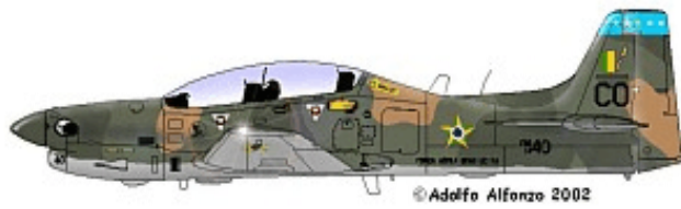
T-27 FAB 1440 CO, 1°/14° GAV ."Grupo de Aviação", 2001.