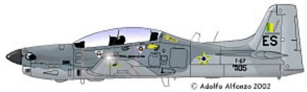
T-27 FAB 1405 ES, 2ª ELO. "2ª Esquadilha de Ligação e Observação", 1995.