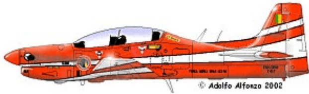
T-27 FAB 1382 "Esquadilha da Fumaca" 1988.