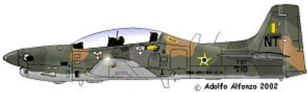
T-27 FAB 1410 NT, 1°/5° GAV. "Grupo de Aviação", 1998.