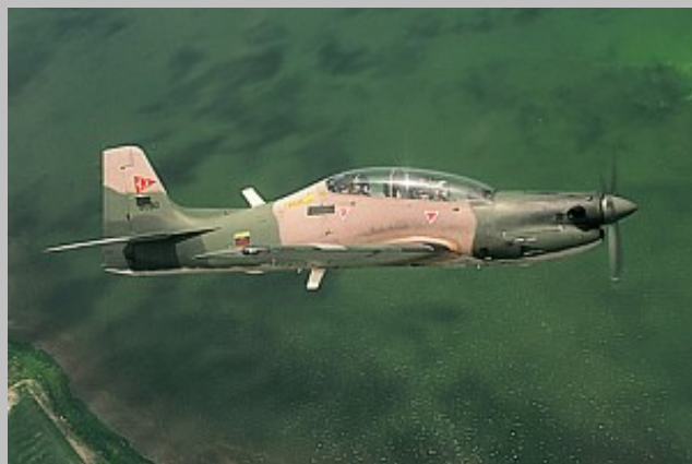
AT-27 Tucano FAV 3050 del GOE No.15 de la Fuerza Aérea Venezolana.